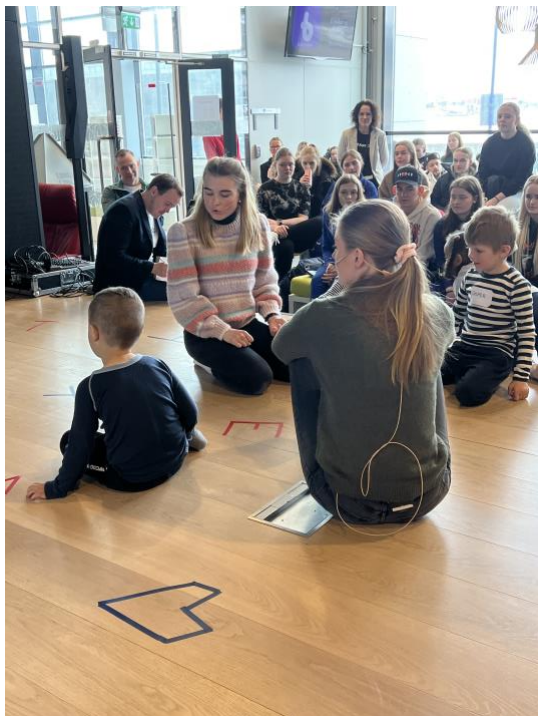
Foto: Fylkesmesterskap Kunnskapsparken på Finnsnes