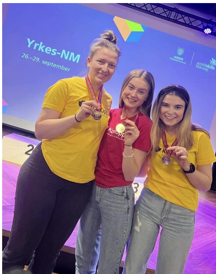
Foto: Yrkes NM 2022, medaljevinnere