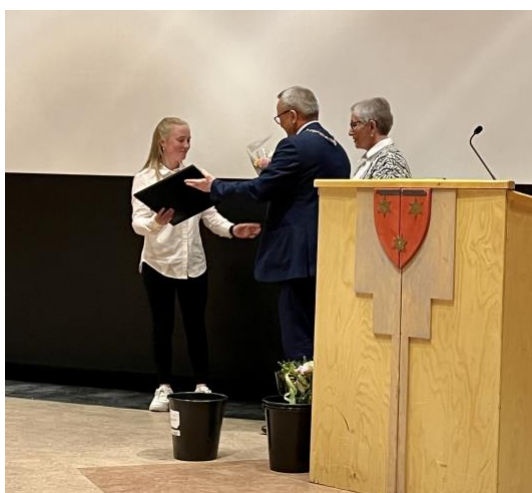
Foto: Fagbrevutdeling i kommunestyret i Sørreisa.

Alle andre som tok fagbrev i 2022 ble invitert av ordfører i sin hjemkommune til å motta fagbrev i kommunestyret. KomOpp dekket utgifter til kake og blomster etter faktura. Dette er en fin måte å synliggjøre lærlingordningen i de ulike kommunestyrene, samt å sette pris på den innsats som veiledere og faglige ledere gjøre.