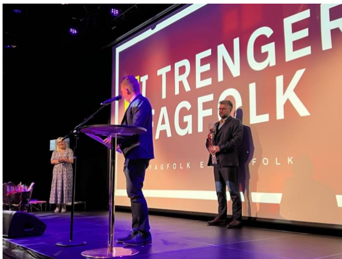
Foto: Fagbrevutdeling i Harstad

I Harstad ble det gjennomført en felles fagbrevutdeling 18.mai, for alle som hadde vært lærlinger i Sør-Troms. Det ble en flott markering av nye fagarbeidere, med deltakelse fra alle opplæringskontor.