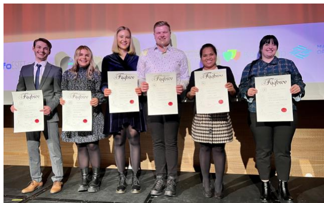
Foto: Stolte fagarbeidere i Tromsø.

Opplæringskontorene i Tromsø inviterte til fagbrevutdeling 3.mars. Det var en verdig markering, med over 300 deltakere.