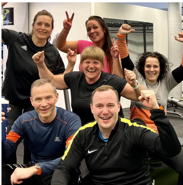
Foto: Felles treningsøkt

På grunn av mye arbeid med datamaskiner både på kontoret og ute i bedriftsmøter er det en økt fare for problematikk knyttet til musearm og skuldre. KomOpp gir de ansatte tilbud om inntil 3000,- per år å benytte til helsefremmende tiltak. Det er fokus på ergonomisk tilpassa arbeidsplasser og trivsel på jobb sammen selvom kontoret har 3 lokasjoner.