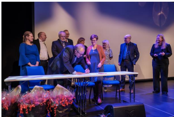
Fra signeringen av læreplassgaranti 18.5.22